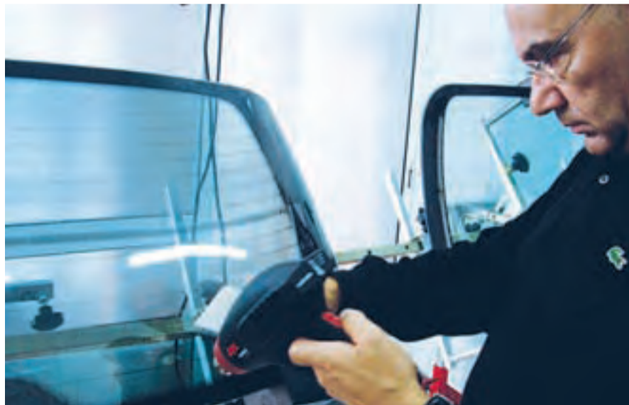
Dispondo de instalações em Camarate (Lisboa), a Sotérmica tem um centro de formação exclusivamente dedicada às películas para automóvel